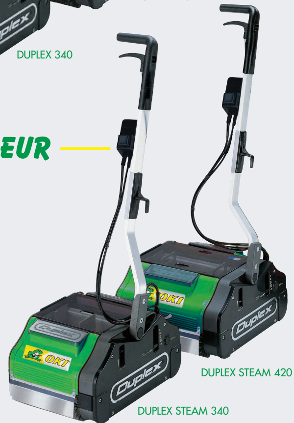
DUPLEX STEAM 420

Encore un avantage sur sols durs, l'ingénieux système de lavage à la vapeur enlève avec efficacité les taches grasses et résistantes sur tous les sols durs et en relief sans utilisation de détergent.