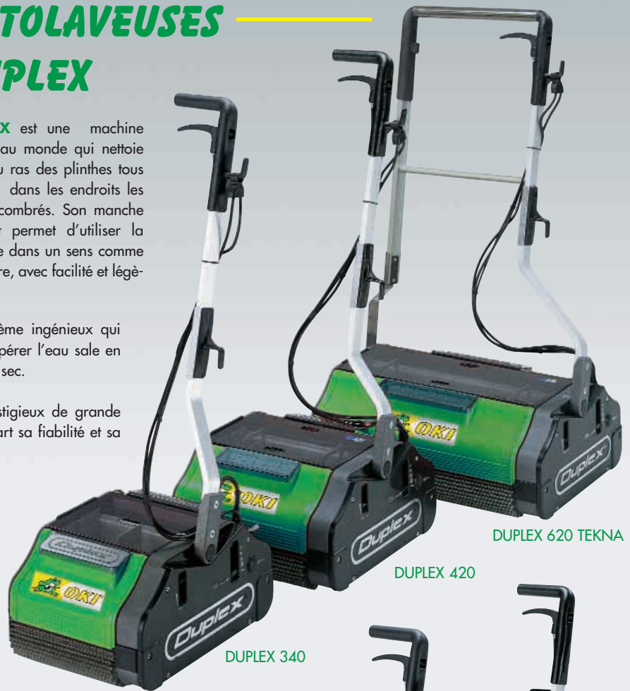
DUPLEX 620 TEKNA